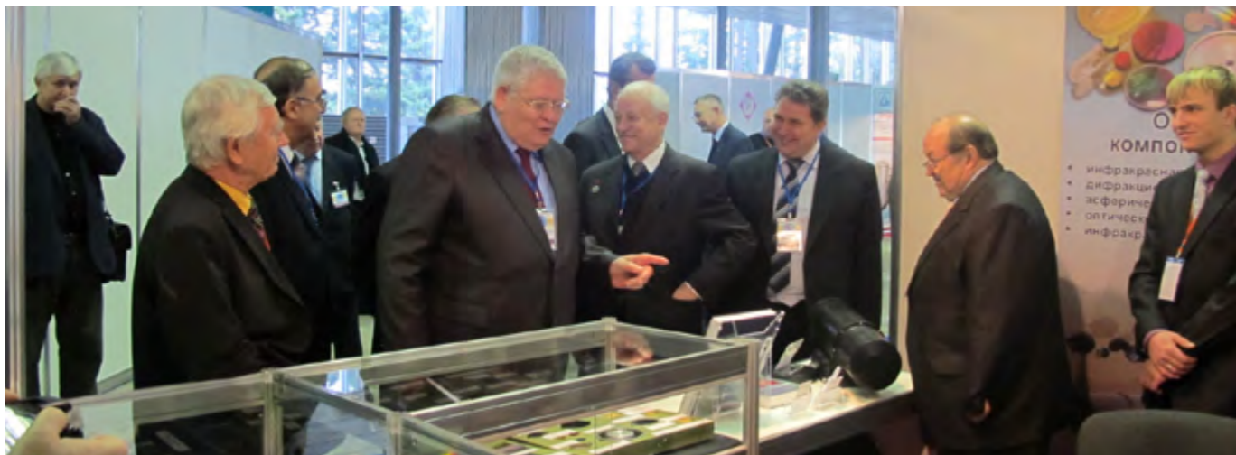
Члены общественного экспертного совета осматривают экспонаты выставки (у стенда ГИПО)

С 20 по 23 ноября 2012 г. в Москве во Всероссийском выставочном центре ( павильон № 57) на высоком научном и организационно-техническом уровне, успешно прошёл 8-й международный форум «Оптические приборы и технологии OPTICS-EXPO 2012».