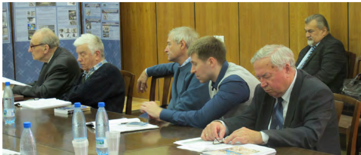
На заседании секции № 4