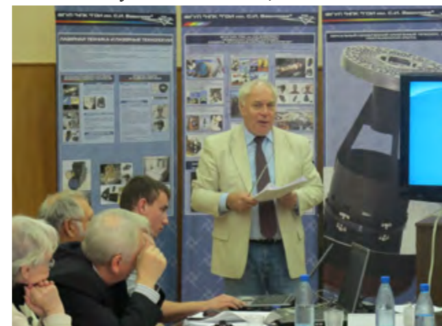
На заседании секции № 4

(г. Сосновый Бор), НПО «Оптика», ГИПО, НПК ГОИ; ведущих заводов отрасли: ОАО «Красногорский завод им. С.А. Зверева», ОАО «Лыткаринский завод оптического стекла», ЦКБ «Фотон» (Казань), ОАО «УОМЗ»; специалисты