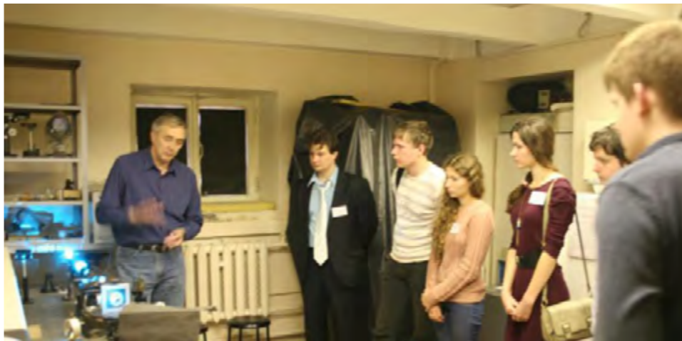
Участники ознакомились с экспериментальными стендами для записи голограмм оптических элементов