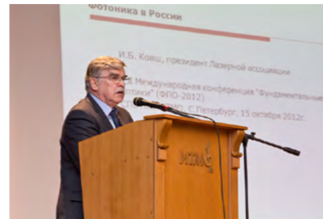
Ковш И.Б. (Лазерная ассоциация, Москва, Россия)

Иван Борисович Ковш – Президент (с 1990 г. – по настоящее время) международной научно-технической организации «Лазерная ассоциация» (переизбирался на съездах Ассоциации в 1994, 1998, 2002, 2006 и 2010 г.г.; доктор физико-математических наук (1992 г.), профессор по специальности «Лазерная физика» (1997 г.); заслуженный деятель науки Российской Федерации (2002 г.). Области его научных интересов: физика и оптика мощных газовых лазеров, лазерная обработка материалов. В 1970 г. – окончил Московский физико-технический институт, факультет физической и квантовой электроники (диплом с отличием). 1970 г. – 1986 г. – сотрудник Физического института им.