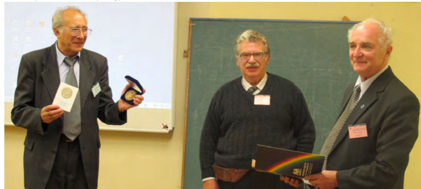
На заседании секции № 3.

В работе конференции приняли участие около 300 специалистов из разных городов России (г.г. Архангельск, Екатеринбург, Иркутск, Казань, Калуга, Красногорск, Красноярск, Лыткарино, Москва, Мытищи, Новосибирск, Нижний Новгород, Новороссийск, Обнинск, Пенза, Пермь, Санкт-Петербург, Смоленск, Сосновый Бор, Тверь, Томск), а также из стран ближнего и дальнего зарубежья. Наибольший удельный вес составили доклады представителей вузовской