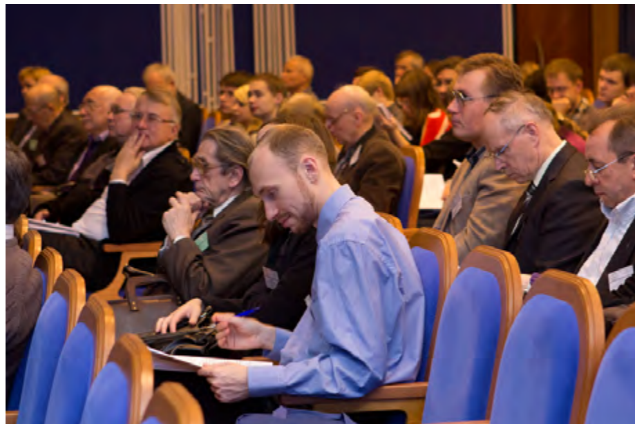
На пленарном заседании