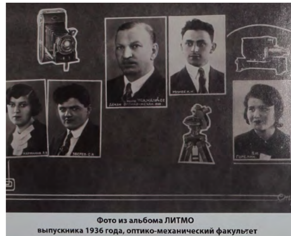
Фото из альбома ЛИТМО выпускника 1936 года, оптико-механический факультет